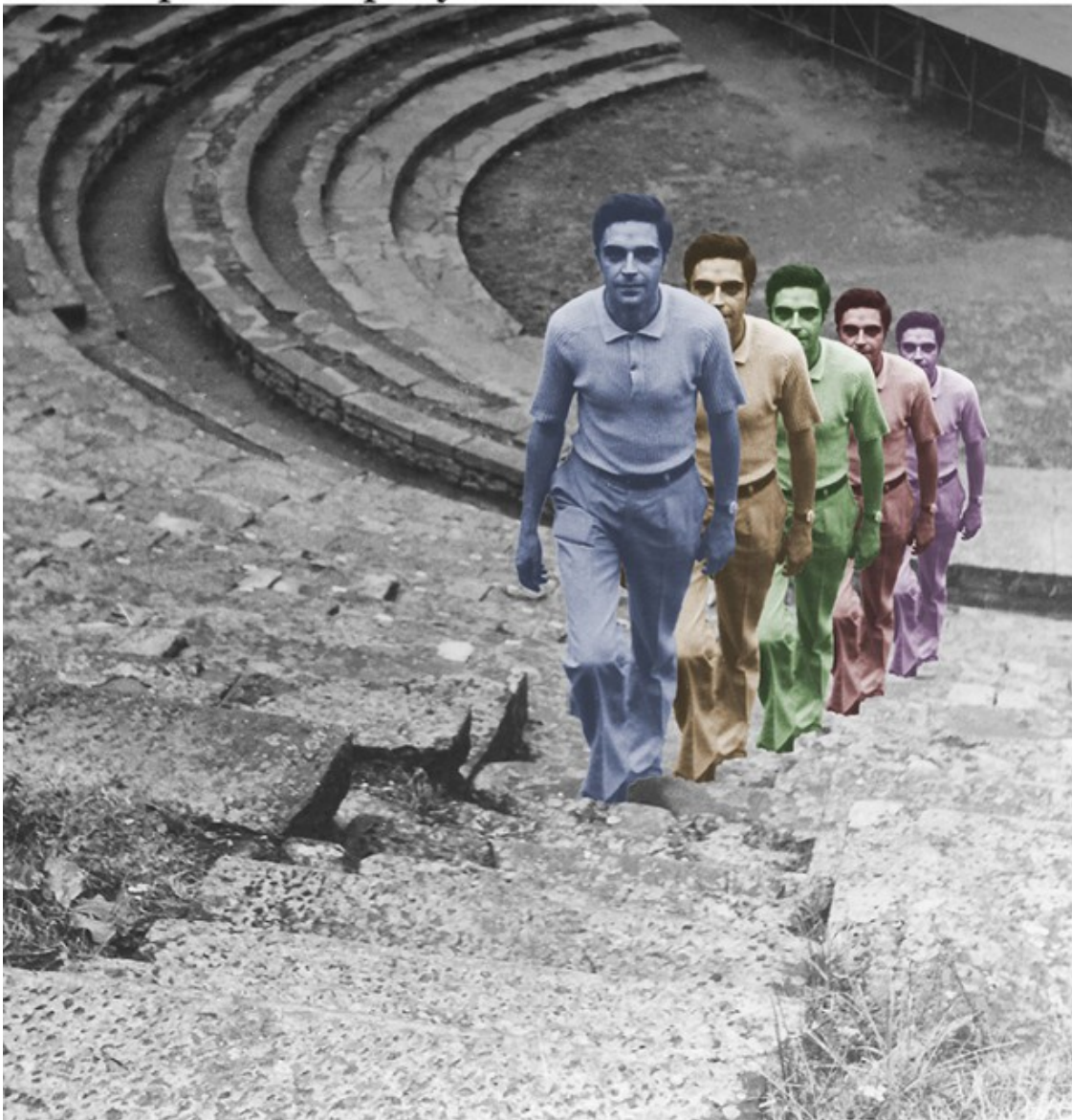
Cartell de Màscares, amb els successius Lluïsos en color