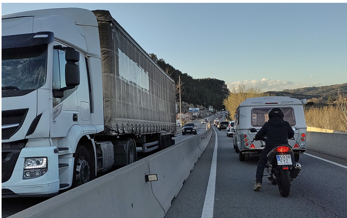
Vehicles circulant a la C-55 a l'alçada de Sant Vicenç de Castellet, al Bages.

El Govern preveu la construcció d'un tercer carril en sentit nord i una variant urbana a Castellgalí amb una inversió de 50 milions d'euros.