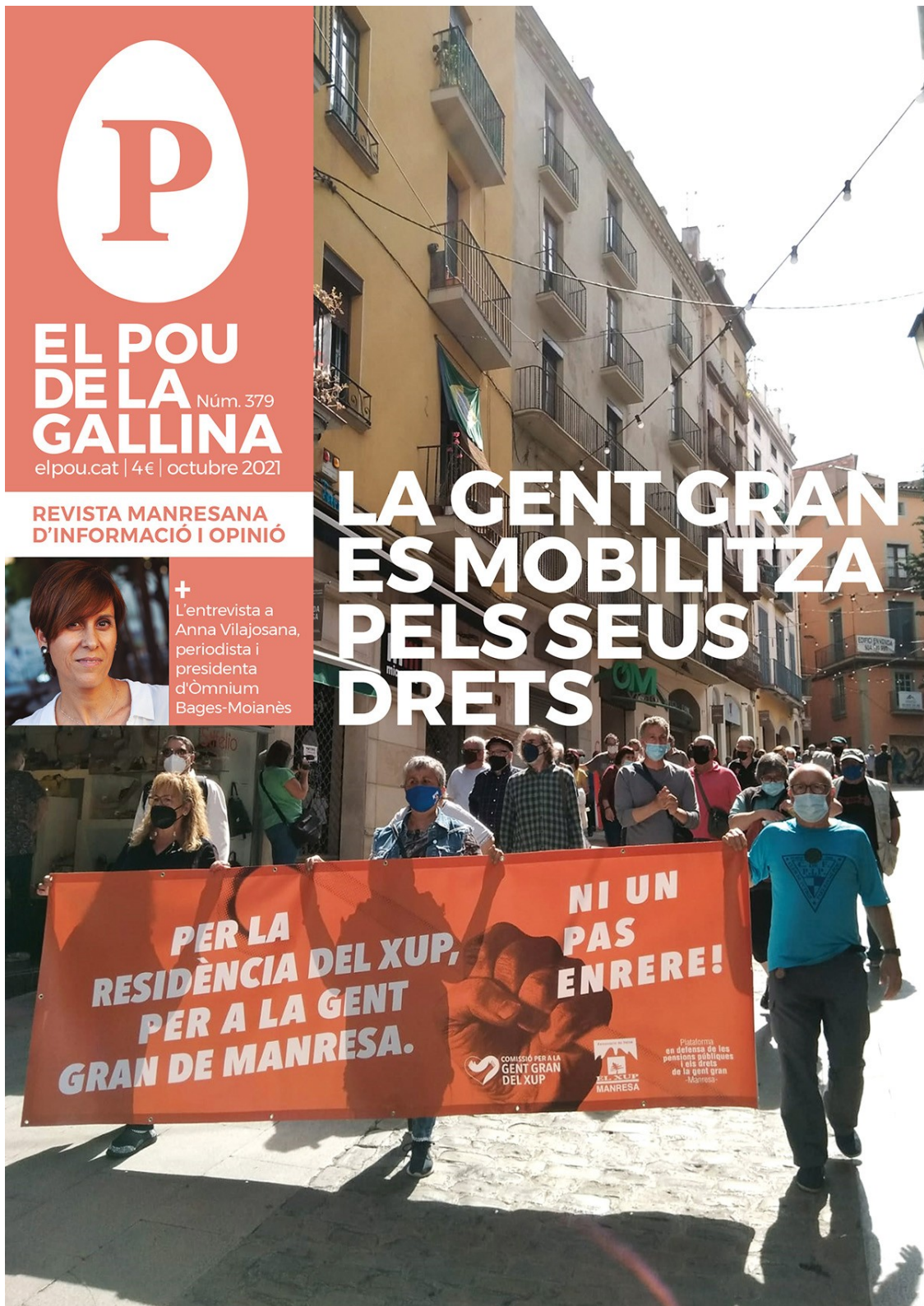
Portada del número 379.