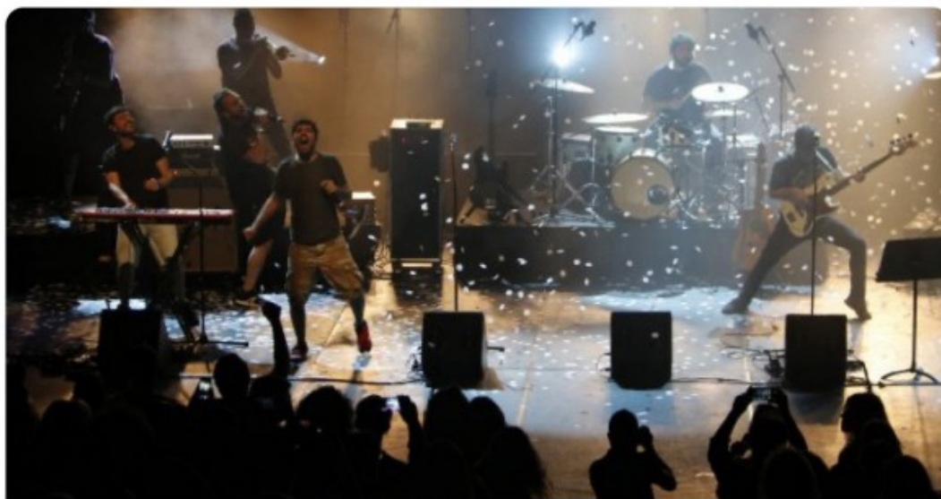
Famós músic català ha de treballar de repartidor de missatgeria - En Blau

Senyors del @elnacionalcat , que treballi a Mrw no vol dir que estigui arruïnat elnacional.cat/enblau/ca/tele... simplement em busco la vida, com tothom. En fi... sou una mica sensacionalistes. I per cert, encara soc un famós músic català?? Gràcies, jejeje