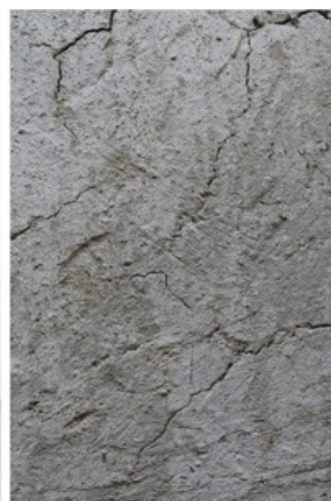
ROSER ODUBER INSTAL·LACIÓ