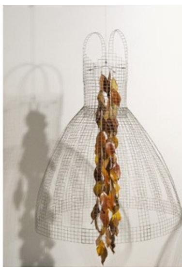
DOLORS PUIGDEMONT ESCLTURES