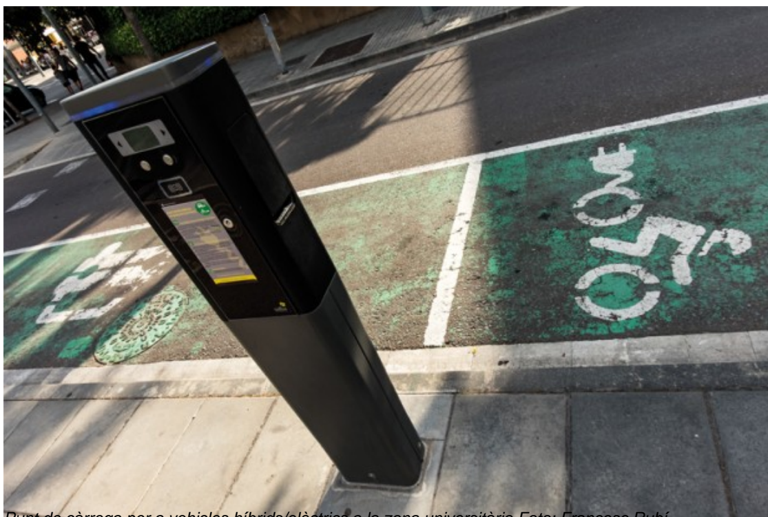
Punt de càrrega per a vehicles híbrids/elèctrics a la zona universitària

TEMA DEL MES. Hi ha consens a definir el concepte ciutat intel·ligent -"smart city"- com una gestió més eficient dels serveis i recursos d'un nucli urbà gràcies a l'ús de les noves tecnologies. Manresa porta temps dotant la ciutat de sensors -en pàrquings, fanals, carrers, semàfors, edificis&hellip;- per obtenir dades en temps real. La capital del Bages forma part de la primera Smart Region d'Europa i acredita satisfactòriament l'adopció de la tecnologia en la gestió municipal.