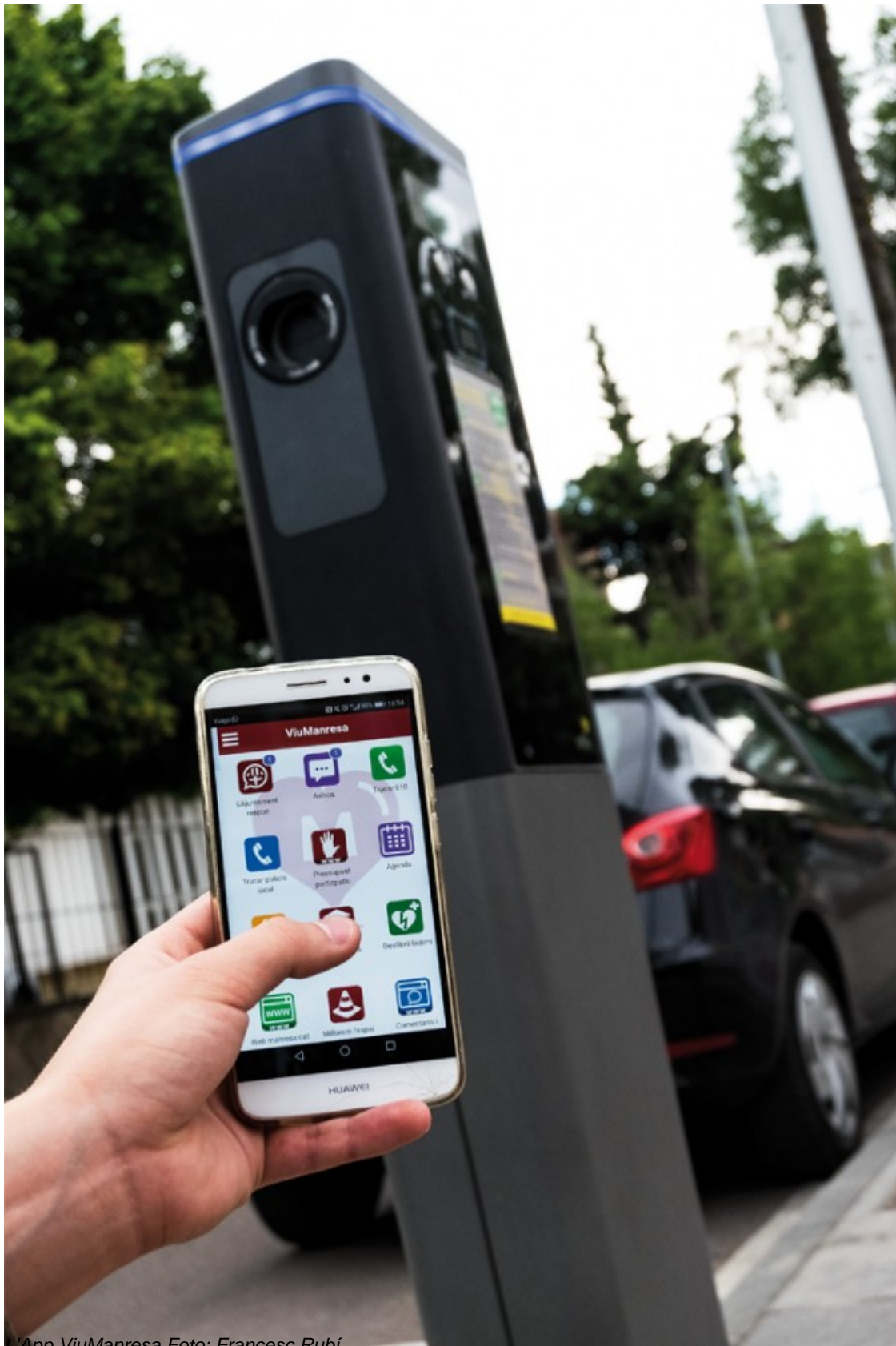
L'App ViuManresa

No estem vivint una època de canvis, estem vivint un canvi d'època. Els grans moments històrics,