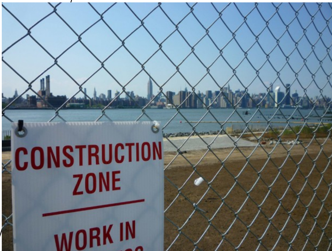
Solar amb vistes a Manhattan a la zona de Williamsburgh

En diferents zones de Brooklyn, l'ambient és decadent i postindustrial. Edificis atrotinats, solars mig derruïts, parc mòbil tronat... Però tot canvia quan la zona es posa de moda i comencen a aparèixer els primers comerços d'articles de segona mà, sales d'art, bars i restaurants i, immediatament, s'hi van col.locant les primeres franquícies de les grans cadenes de roba i menjar. En aquell moment, acaba un cicle ja que els preus de l'habitatge es disparen i la rehabilitació d'edificis i espais urbans públics ja només es centra en fer negoci arrendant apartaments de luxe.