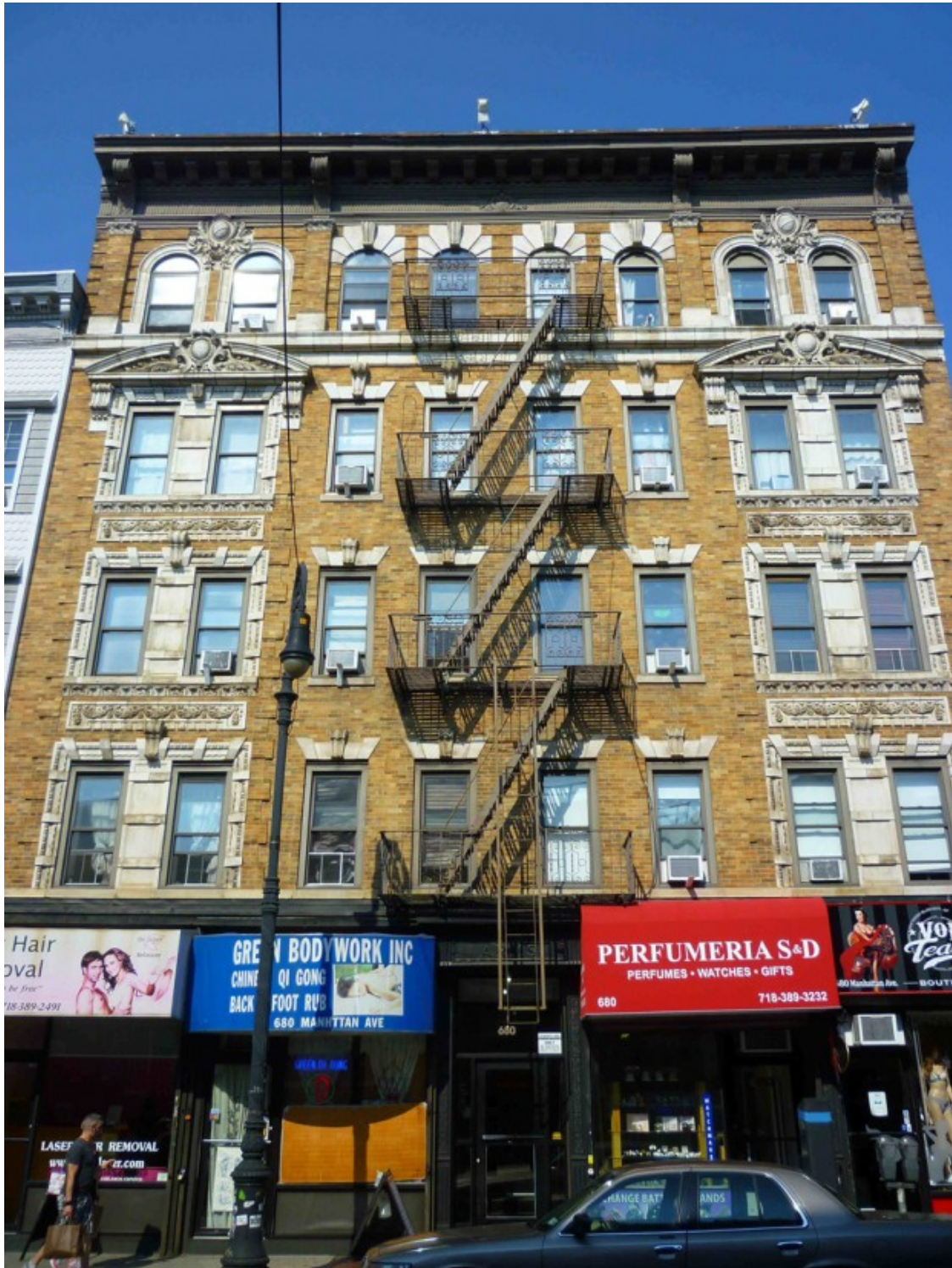
Edifici amb baixos comercials a Manhattan Avenue, al suburbi de Green Point.