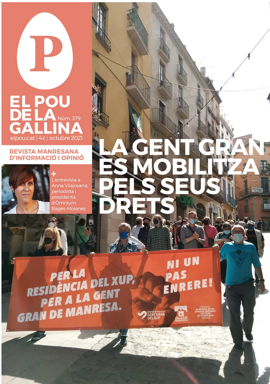
Portada del número 379.