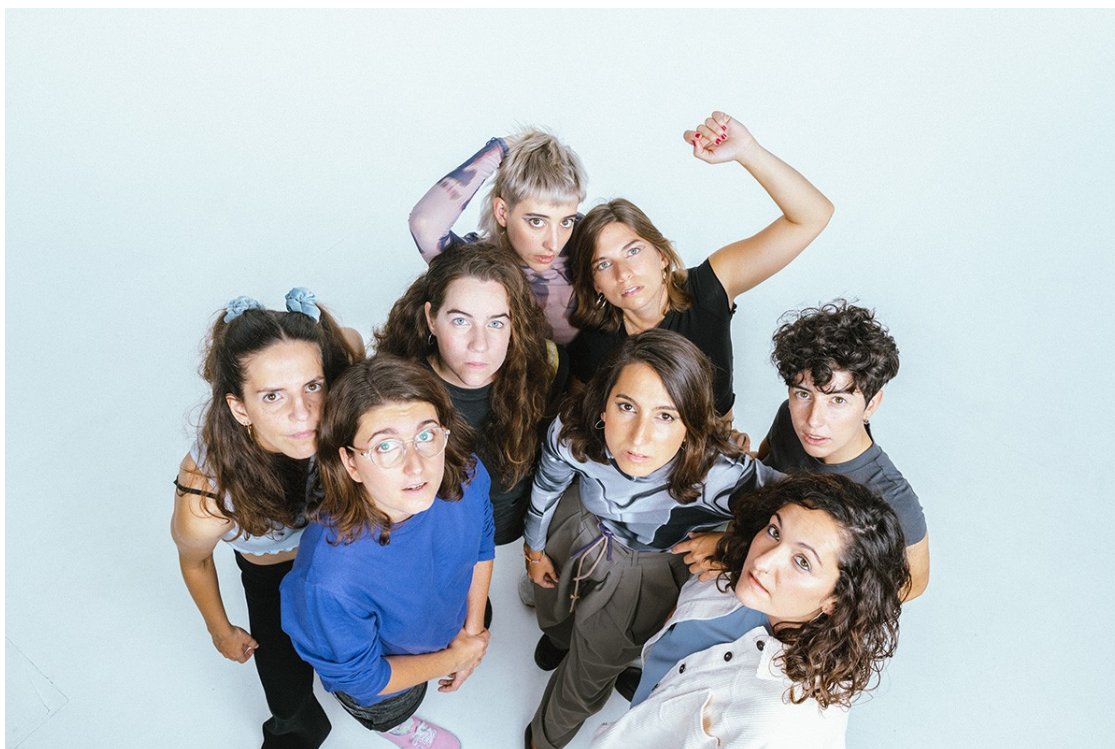
Roba Estesa.

Aquest mes tenim l'agenda cultural carregada. Les recomanacions de música, art i teatre de l'octubre.