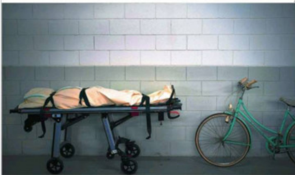
Un cadáver espera su turno para la cremación en una funeraria de Manresa. Se han extremado las precauciones y los cuerpos se depositan directamente en las ataúdes

El presidente había cerrado con el vicepresidente acelerar la medida