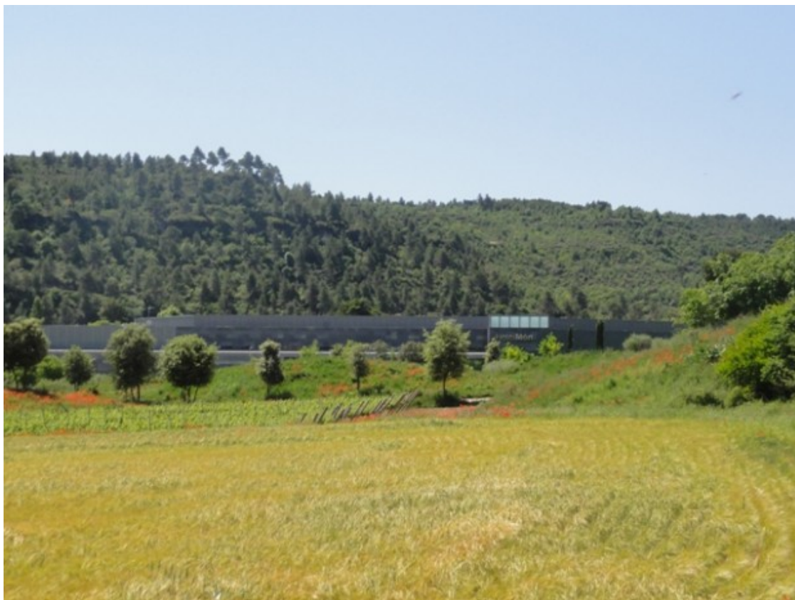
Vista de Món Sant Benet des del camí a la font dels Burjons.

El sender continua per diverses parets de pedra, i quan sembla que el caminet no s'acaba sentirem un raig d'aigua que ens indica que hem arribat a la font de Burjons, coneguda per les seves qualitats terapèutiques. Les copes dels arbres tanquen amb les fulles aquest espai i hi donen un toc bohemí, barrejat amb el sol i el cant dels ocells. Un lloc molt recomanable per desconnectar una estona.