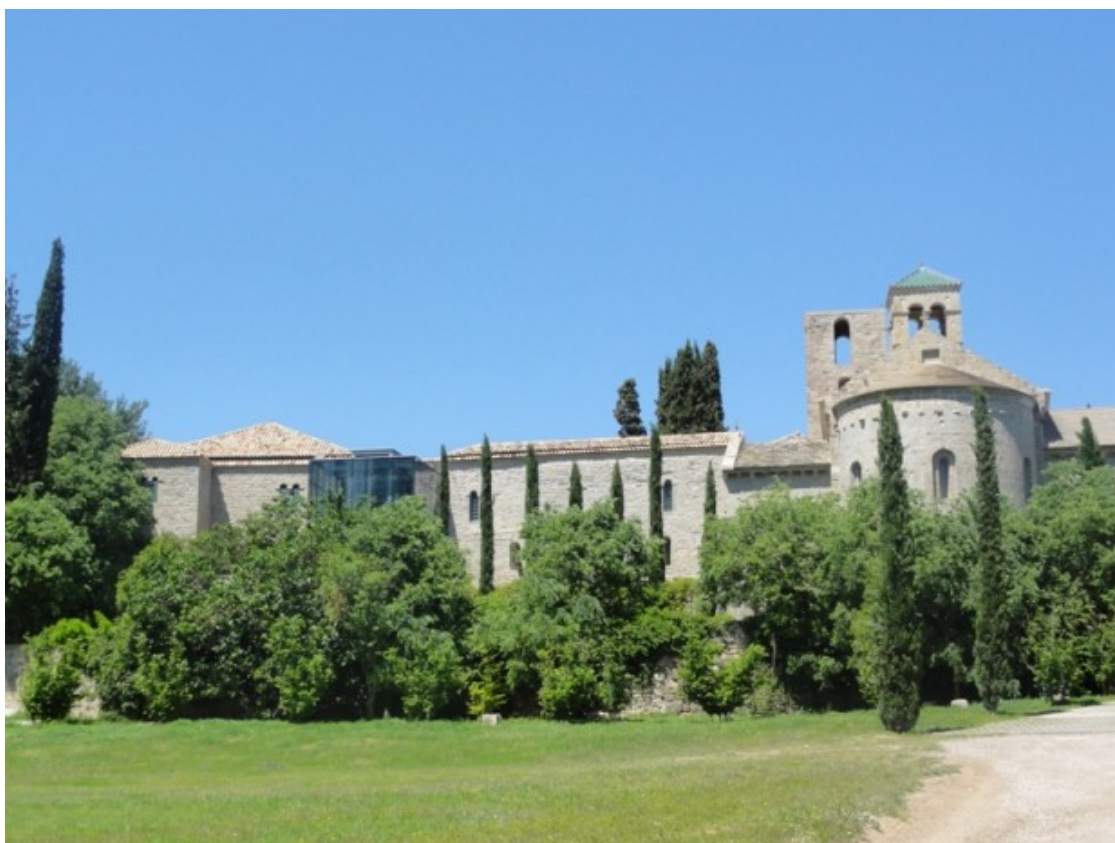
El Monestir de Sant Benet de Bages, punt d'inici de l'itinerari

RUTES. Una nova ruta per descobrir, aquesta vegada a prop del Monestir de San Benet, situat entre el municipi de Sant Fruitós i Navarres. Un indret que data del segle X, envoltat per grans boscos.