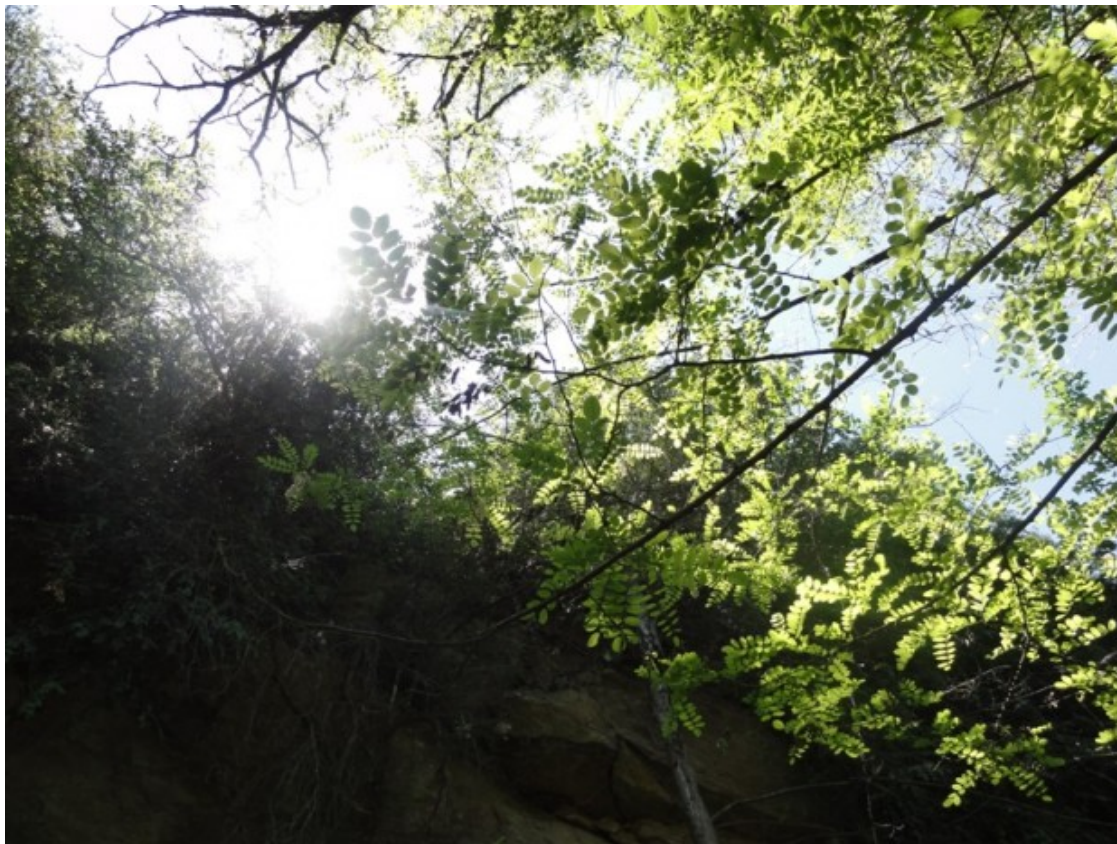
La bauma de la font dels Burjons.

A més, Món Sant Benet ofereix altres rutes per gaudir del contacte amb la naturalesa: el camí paisatgístic de Sant Benet de Bages (5,8 km), que porta a un mirador amb una vista privilegiada; les tines de Solanes i del Llobregat (9 km), que voreja el riu fins arribar a unes tines aïllades enmig de la vinya i no adossades a la masia; i una part del camí de Sant Jaume (10 km). Aquesta última ruta es remunta al segle IX i arriba fins a Manresa.